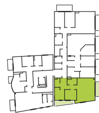
Mieszkanie z balkonem